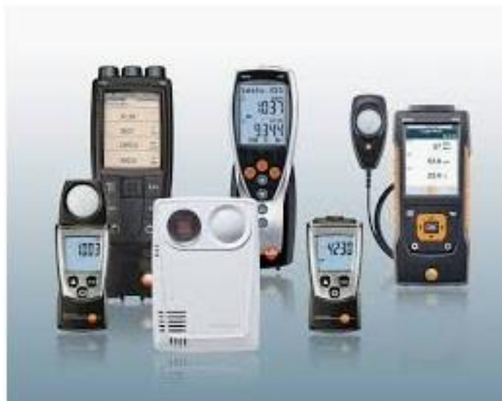
Slika: 2. Uređaji za mjerenje nivoa buke

su impulsni mjerači zvuka koji se koriste za različite namjene. Impulsni mjerači kao instrumenti za mjerenje buke spadaju u red univerzalnih mjerača zbog toga što omogućavaju mjerenje nivoa svih vrsta signala.