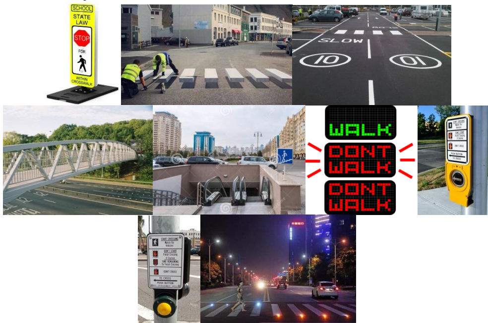
Slika 2. Rješenja na pješačkim prelazima koja pomažu povećavaju sigurnosti pješaka (prenosivi znakovi, 3D zebre, upozoravajući natpisi, izdvojeni pješački prelazi, svjetlosna signalizacija za pješake, zvučni signali i gumb za poziv)

inače ne tako prometnim raskrscima i ulicama. Sistem radi i u suprotnom smjeru, pa otkazuje pojavljivanje zelenog svjetla za pješake ako se u datom trenutku niko ne nalazi u blizini pješačkog prelaza. Osim smanjenja gužve, sistem imati i veliku ulogu u povećanju sigurnosti saobraćaja;