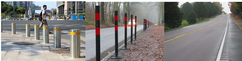
Slika 3. Mjere sigurnosti i zaštite na pješački hodnicima (trotuarima)