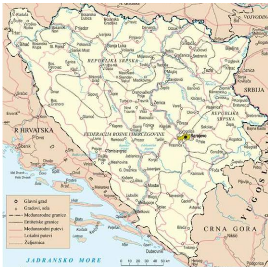
Slika 1.: Geografski položaj TE Kakanj

Termoelektrana „Kakanj“ je građena u etapama, trenutno su u funkciji blokovi 5 i 6 instalisane snage po 110 MWe i blok 7, instalisane snage 230 MWE. Blokovi 1-4 su trajno stavljeni van pogona i u narednom periodu je planirano njihovo rušenje. U poslijeratnom periodu izvršena je rekonstrukcija i modernizacija svih blokova čime je proizvodni vijek postrojenja produžen za 15 godina.