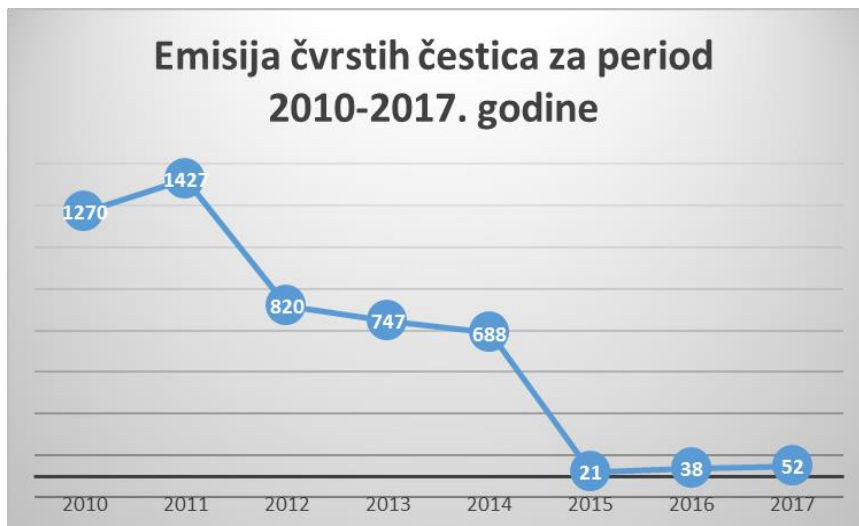
Grafikon 2.: Grafički prikaz smanjenja emisije čvrstih čestica iz TE „Kakanj“ za period 2010-2017. godine

Tokom 2011. i 2012. godine ugrađeni su gorionici sa niskom emisijom \text{NO}_x čime je koncentracija ovog polutanta smanjena na 950 \text{ mg/m}^3 , no time nisu zadovoljeni zahtjevi o GVE propisani Pravilnikom o graničnim vrijednostima emisije u zrak iz postrojenja za sagorijevanje Federacije Bosne i Hercegovine*, ali i Direktive 2010/75/EU.