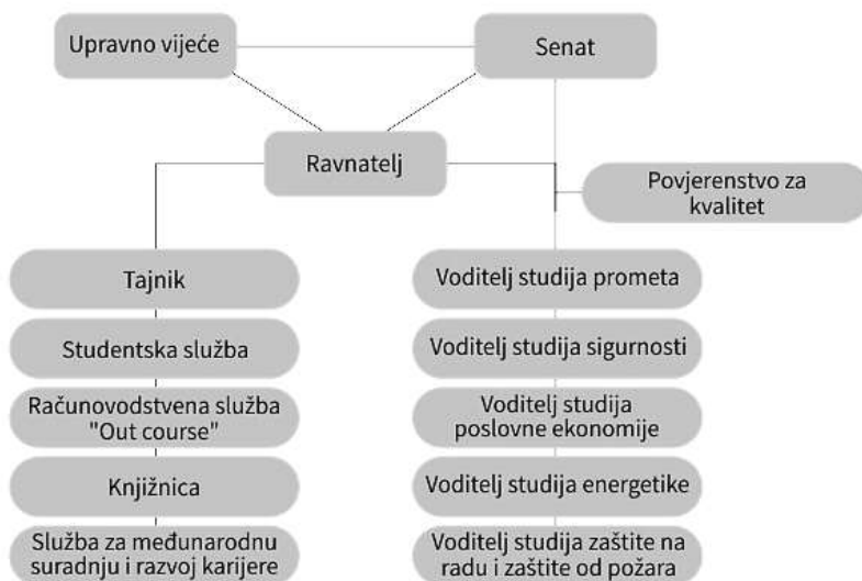
Slika 1. Povjerenstvo za kvalitet u organizacijskoj strukturi CEPS-a 7

Povjerenstvo za kvalitet CEPS-a osnovano je odlukom Senata CEPS-a. Povjerenstvo ujedinjuje i usklađuje sve aktivnosti vezane za kvalitet, te ima slobodu prilagodbe postupaka sistema za kvalitet sukladno potrebama CEPS-a. Članovi povjerenstva su: