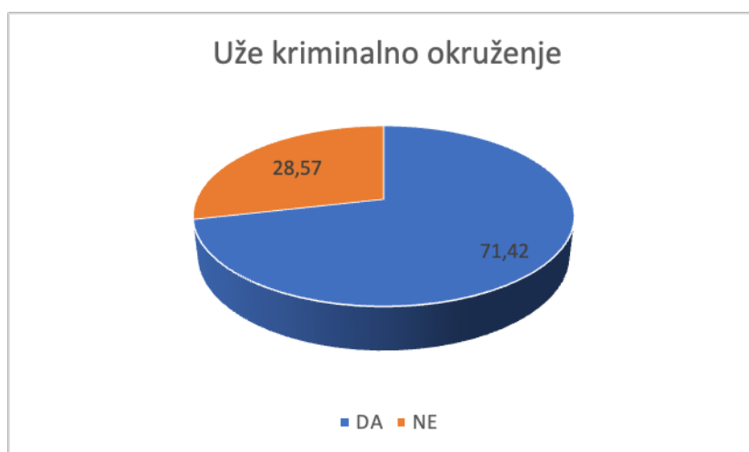
Grafikon 3. Osuđivanost članova porodice?

Obzirom da žene spadaju u ranjivu kategoriju sa nizom specifičnosti koje se ogledaju u fiziološkim, sociološkim, ekonomskim te kulturološkim razlikama možemo zaključiti da funkcionalna bračna zajednica kao faktor utiče na stabilnosti žene te njihovu kriminalnu historiju odnosno recidivizam.